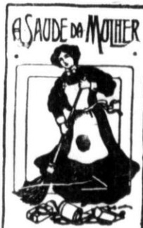
Para obter resultados rápidos, use de vez em quando este preparado. Não é preciso de receita para ser tomado.

Remedio eficaz para as perturbacoes da mulher